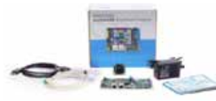
phyBOARD-Pollux Development Kit