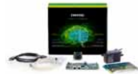
phyBOARD-Pollux AI Kit