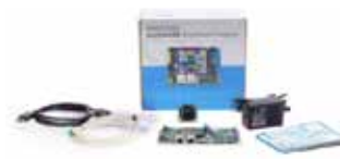
phyBOARD-Pollux Imaging Kit